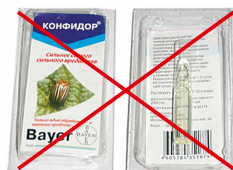
Зразок підробки препарату Конфігдор-Максі