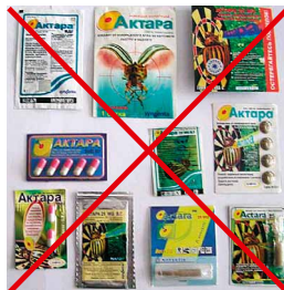
Підробки інсектициду Актара

У разі виникнення навіть найменших сумнівів щодо того, чи справжній пестицид ви тримаєте в руках, не зволікайте - завжди звертайтеся до компанії-виробника!