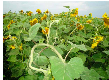
Мал. 2. Приклад застосування незареєстрованого в Україні гербіциду невідомого складу. Результат: поле соняшнику справляє гнітюче враження...

Фальсифіковані пестициди, навіть за наявності діючої речовини, аналогічної тій, що є в оригінальному препараті, містять неперевірені допоміжні речовини (стабілізатори, ад'юванти, барвники тощо) невідомого походження, що можуть формувати непередбачені шкідливі сполуки! Це можуть бути або суто технічні домішки, які мають найнесподіваніші якості і активність, або більш дешеві речовини, часто токсичні, покликані замінити собою якісні компоненти оригінального препарату та зробити підробку дешевою. Тому