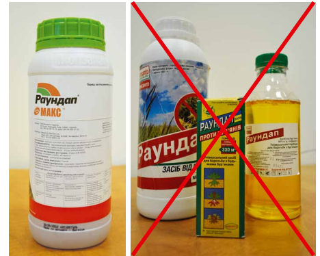
Мал. 4. Ліворуч – оригінальний препарат, праворуч – підробки

УВАГА! В Україні державну реєстрацію отримує виключно препарат під певною назвою, тому продаж окремих компонентів означає, що ця сировина потрапила до країни в нелегальний спосіб!