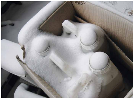
Мал. 1. Склад, на якому зберігаються фальсифіковані пестициди і агрохімікати (Примітка: пестициди потребують особливих умов зберігання, в т.ч. певного температурного режиму та ізоляції від навколишнього середовища!).

УВАГА! Інформація про безпеку фальсифікованих ЗЗР відсутня або обмежена, їхня дія – непередбачувана, а завдана шкода – істотна та довговічна.