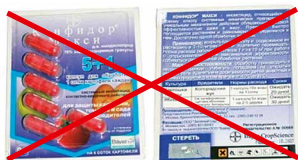
Зразок підробки препарату Конфігдор-Максі

Компанії-виробники приділяють значну увагу інформуванню ринку про проблему підробок, ведуть активну роз'яснювальну роботу через ЗМІ, семінари, дні поля, інформаційні листи, друковані матеріали тощо. Ведеться робота з підвищення обізнаності учасників ринку (насамперед, аграріїв) з характерними маркувальними ознаками, що відрізняють оригінальні пестициди від фальсифікату.