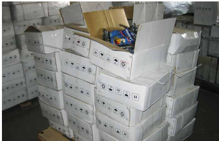
Мал. 3. Склад, на якому зберігаються фальсифіковані пестициди і агрохімікати невідомого походження та окремо – етикетки.

фальсифіковані пестициди є не лише не-ефективними, а й майже завжди призводять до непередбачуваних наслідків та завдають значної шкоди!